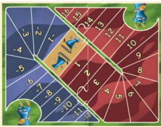
1 tavoliere (diviso in 2 parti)