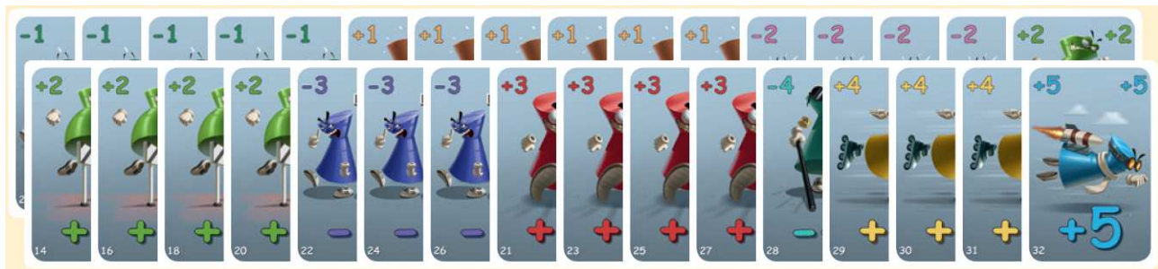
32 carte Corsa con la seguente distribuzione: