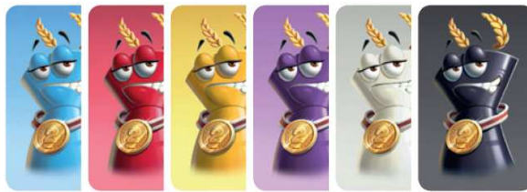
6 carte Colore